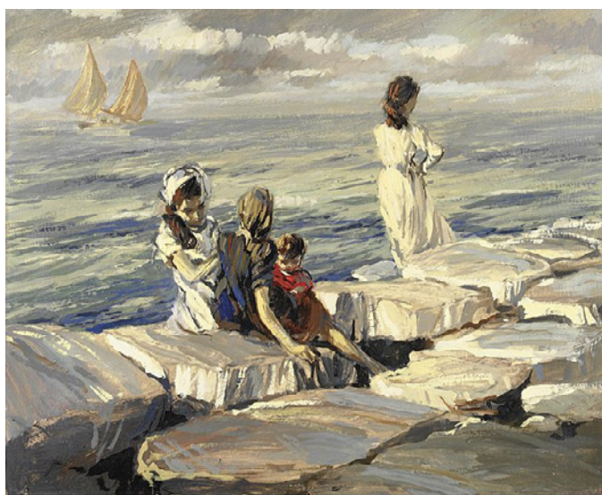
L'Attesa – Ettore Tito, 1930

categoria dell'esistenza umana, sia quella oggettiva misurata dalle lancette dell'orologio e uguale per tutti, che quella vissuta, soggettiva, diversa per ciascuno di noi. Il sentimento della speranza non può che essere coniugato con la categoria del tempo. (Tra l'altro, ognuno di noi crede di sapere che cos'è il tempo, ma, se richiesto di spiegarlo, si trova in imbarazzo).